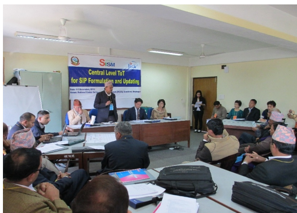
सानोठिमीमा सञ्चालित केन्द्रस्तरीय तालिम, मंसिर २०७०

सिसम-२ परियोजनाले १) केन्द्रीयस्तरीय प्रशिक्षक प्रशिक्षण, २) जिल्लास्तरीय प्रशिक्षक प्रशिक्षण ३) स्रोतकेन्द्रस्तरीय तालिम जुन प्रत्येक विद्यालयको, विद्यालय सुधार योजना निर्माणमा समितिको प्रमुख पदाधिकारीहरूको लागि र ४) विद्यालयमा विद्यालय सुधार योजना निर्माणको लागि विद्यालयस्तरीय कार्यशाला गरी चार तहको तहगत (Cascade) तालिम सञ्चालन गर्ने योजना बनाएको छ ।