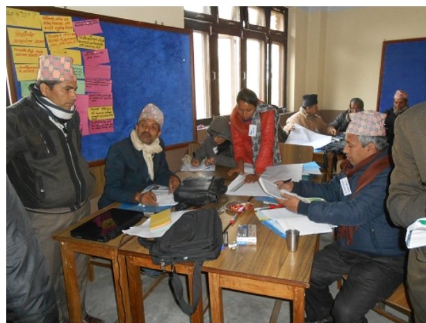
रूपन्देहीमा सञ्चालित जिल्ला स्तरीय तालिम, पुस २०७०

यस तालिममा २९ पुरुष र २ महिला गरी जम्मा ३१ सहभागीहरूले भाग लिएकोमा १ जना शिक्षा मन्त्रालय, २ जना शिक्षा विभाग, २ जना शैक्षिक जनशक्ति विकास केन्द्र, २ जना पाठ्यक्रम विकास केन्द्र, ५ जना क्षेत्रीय शिक्षा निर्देशनालय, ४ जना शैक्षिक प्रशिक्षण केन्द्र, १२ जना चार परीक्षण जिल्ला (सोलुखुम्बु, रूपन्देही, जुम्ला र डोटी) का जिल्ला शिक्षा कार्यालय, २ जना फलो अप जिल्ला (रसुवा र धादिङ्ग) का जिल्ला शिक्षा कार्यालय र २ जना अन्तर्राष्ट्रिय गैरसरकारी संस्थाबाट सहभागी भएका थिए । यस केन्द्रीयस्तरीय प्रशिक्षक प्रशिक्षणमा शिक्षा विभाग, पाठ्यक्रम विकास केन्द्र, शैक्षिक जनशक्ति विकास केन्द्र, जाइका/सिसम-२ र राष्ट्रिय/अन्तर्राष्ट्रिय गैरसरकारी संघसंस्थाका सहजकर्ताहरूले प्रशिक्षण गर्नु भएको थियो सहभागीहरूलाई सिसम-२ को अवधारण, उद्देश्य र कार्यान्वयन प्रक्रिया प्रष्ट गरी बुझाउन र केन्द्रीयस्तरीय प्रशिक्षक प्रशिक्षणबाट अपेक्षित परिणाम हासिल गर्न पूर्णरूपमा सफल भई तालिमका सहभागीहरू सिसम-२ का लक्षित जिल्लाहरूमा तहगत तालिम सञ्चालन गर्न तयार भएका थिए ।